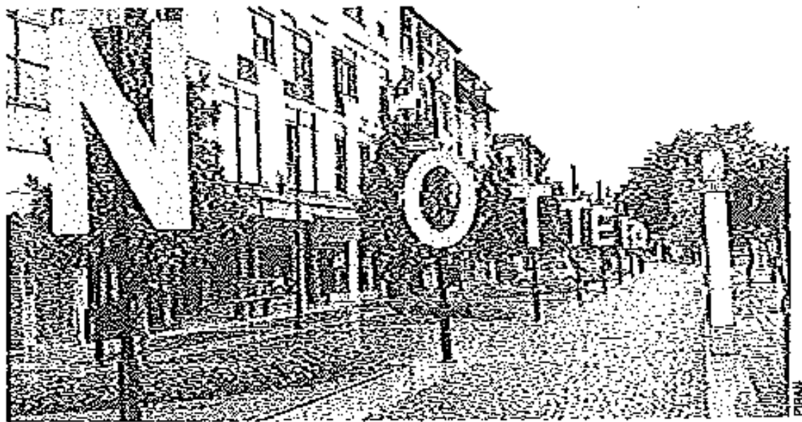
ENORMI CARTELLI. Preparativi per la Notte Rosa delle Terme

La simpatica iniziativa fa parte della coreografia e dei preparativi che stanno coinvolgendo tutte le attività economiche del bacino termale, dagli albergatori, ai commercianti e i pubblici esercenti. Anche il Mattino farà la sua parte, sponsorizzando e seguendo passo a passo l'evolversi della festa, fornendo le indicazioni utili a quanti vor-